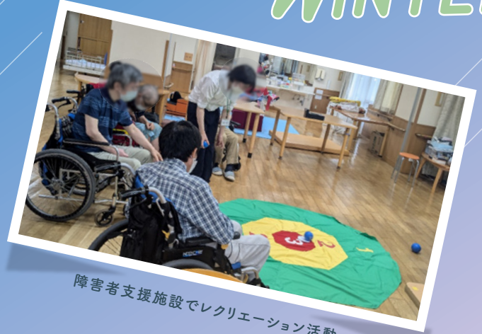
障害者支援施設でレクリエーション活動